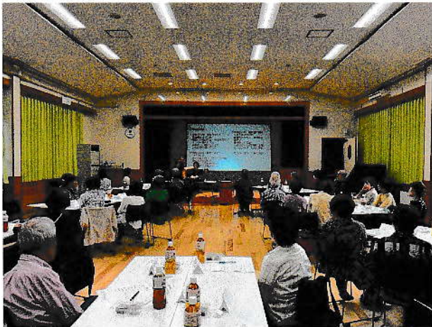
9月29日 創立10周年記念サロン