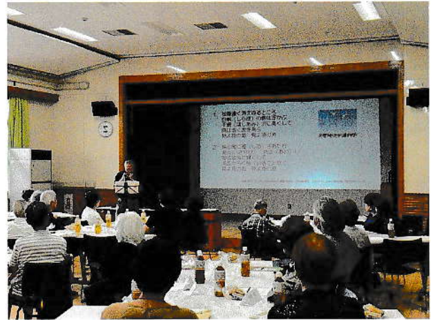
7月15日 お茶の間サロン

今年度は利用会員様と活動者様が一緒に集う「お茶の間サロン」をコミュニティセンターで、7/15（火）9/29（月）12/12（金）3回開催出来ました。