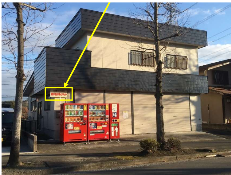
地図（鶴が丘一丁目の三叉路信号の近くです）